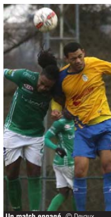
Un match engagé.

Privé de sept joueurs importants de l'effectif comme Dos Santos, Archambeau ou encore Kalulika, Jette est parvenu à garder ses cages inviolées et à mettre fin à une série de quatre défaites de rang. Une prestation défensive aboutie des hommes de Vincent Kohl avec les moyens du bord qui permettent aux Jettois de souffler. « On aurait même pu l'emporter en fin de partie avec les contres qui se sont offerts à nous », ajoutait le T1 jettois. « Il faut quand même