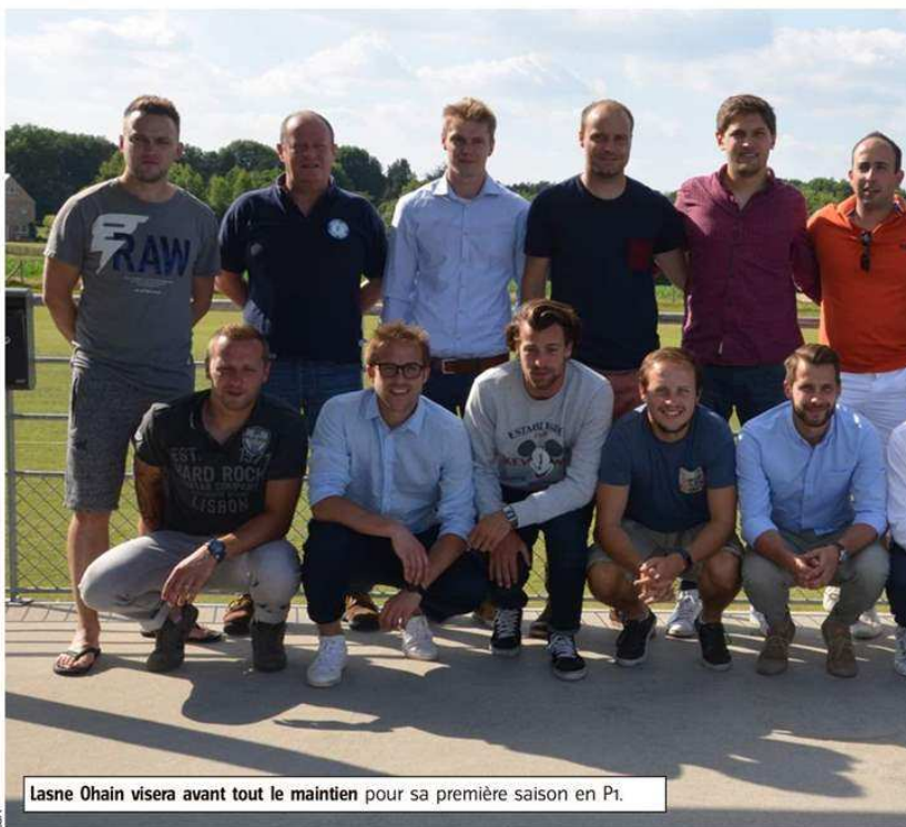
Lasne Ohain visera avant tout le maintien pour sa première saison en P1.

À ce titre, se stabiliser au sein de l'élite provinciale va très vite devenir une obligation pour Lasne-Ohain. « On visera le milieu de tableau, annonce notre interlocuteur. Le but est de rester en P1 tout en continuant à former nos jeunes. On repart avec le même noyau, auquel on a ajouté quelques nouveaux. Et, dans une série qui s'annonce un peu moins forte, on devrait pouvoir atteindre notre